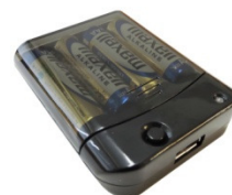
⑤電池ボックス(単3電池4本)

箱を開けてすぐにご確認ください。不足している場合は、サポートセンターまでご連絡ください。